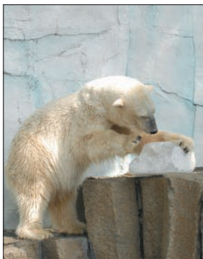
ホッキョクグマに氷のプレゼント

動物園がおこなう事業をご理解いただき、動物たちの飼育環境や展示などの改善に資金を提供していただき、「動物園サポーター」を募集しています。これまでに納められた資金は、動物本来の行動を引き出す展示設備や動物たちの遊具、飼料の購入などに使われてきました。これからも動物たちにとって、より良い環境や展示を実現していくために、みなさまのご協力をお願いいたします。