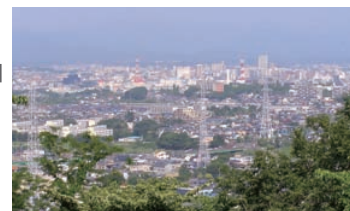
ひとやすみ：みはらし広場からの眺め