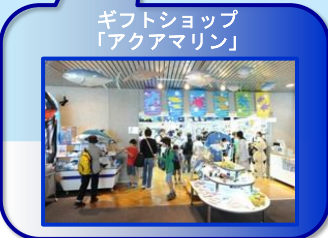
ギフトショップ「アクアマリン」