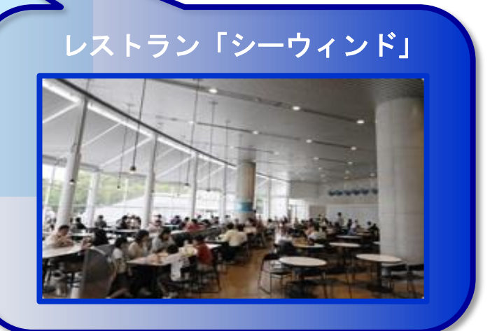
レストラン「シーウィンド」