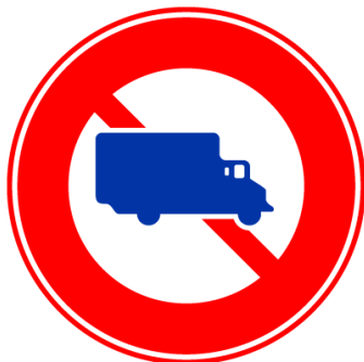
大型貨物自動車など 通行止め