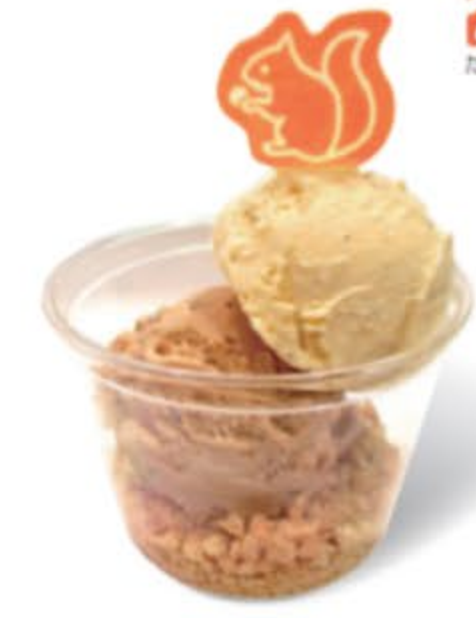
リスの小径アイス ¥380