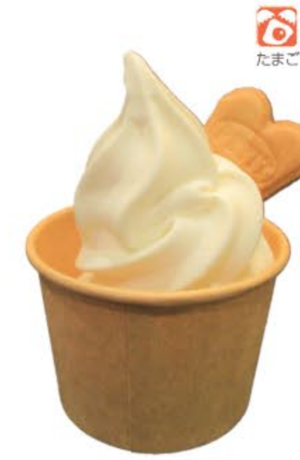
ソフトクリーム (バニラ・チョコ・ミックス) ¥350