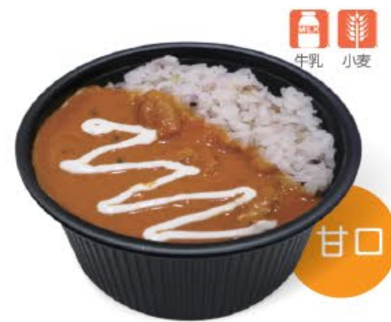
十八穀ごはんの濃厚 バターチキンカレー ¥800