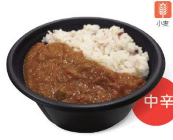
十八穀ごはんの 7種の野菜カレー (お肉のかわりに大豆加工品が入っています) ¥780