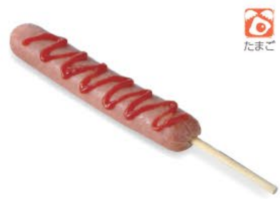
フランクフルト(ポーク100%) ¥330