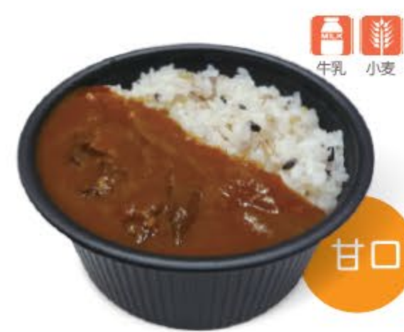
十八穀ごはんの ハヤシライス ¥780