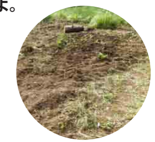
あとはいきものの力に任せてお休みです。