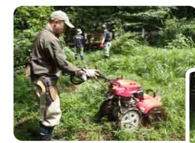
機械や人力で耕します。

7月22日に管理作業を行いました。原っぱの一部を耕し、お休みさせています。そうするとダンゴムシやミミズが土を柔らかくしてくれます。色んな植物が生えて、色んないきものが集まってくるようになりますよ。