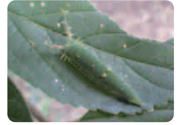
今年はあまり見られていなかったのですが、小さなエノキでしっかり育っていました。