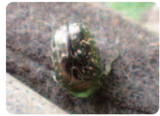
カブトムシは少なくなりましたが、彼らはまだバナナトラップに来ていますよ。

都会にすら私たちの身近にも、実はいろいろな生き物がくらしています。何もいないように見えるのは、私たちがその存在に気づくことができないだけなのです。「いきもの広場」はそうした生き物たちとの出会いを楽しむ場です。