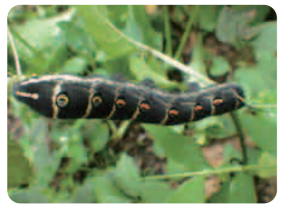
ヤブガラシを食べます。探してみよう。