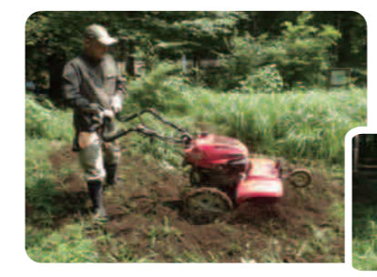
機械や人力で耕します。

7月22日に管理作業を行いました。原っぱの一部を耕し、お休みさせています。そうするとダンゴムシやミミズが土を柔らかくしてくれます。色んな植物が生えて、色んないきものが集まってくるようになりますよ。