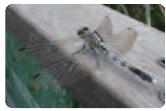
オスはグレーですが、メスは黄色。ムギワラトンボと呼ばれます。