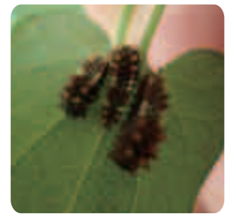
← ジャコウアゲハの幼虫 (リスの繁殖棟) ウマノズクサにきます。イボイボしていて変わった姿です。

「いきもの広場」だけではありません。広場の外にだっていきものはいます。さがしてみよう。