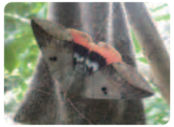
こちらバナナトラップに来る虫です。後ろ翅の色が鮮やか。