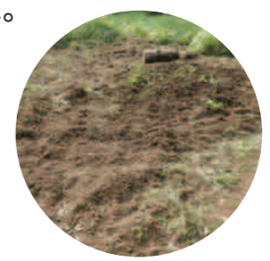
あとはいきものの力に任せてお休みです。