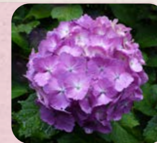
⑥ セイヨウアジサイ