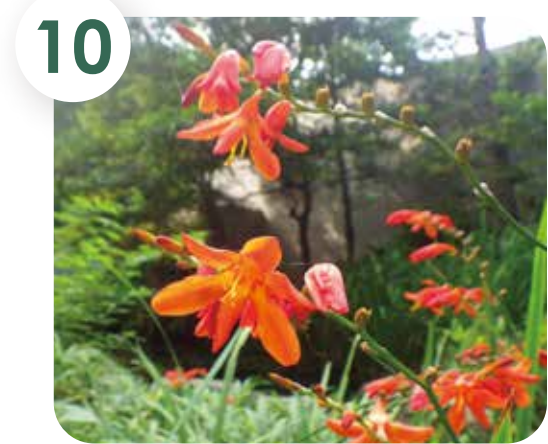
10 ヒメヒオウギズイセン