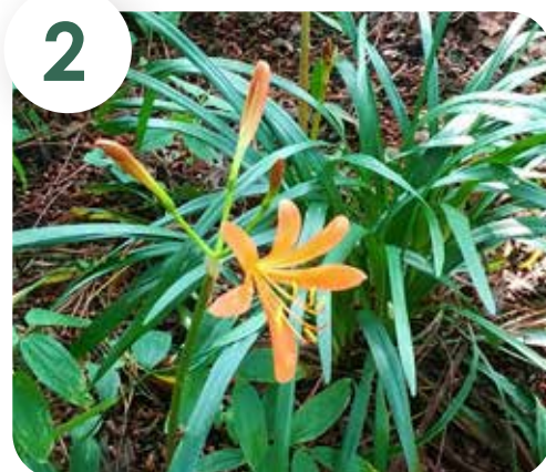
2 キツネノカミソリ