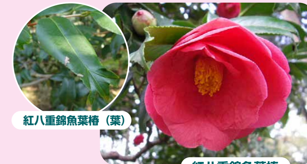
紅八重錦魚葉椿 (葉)