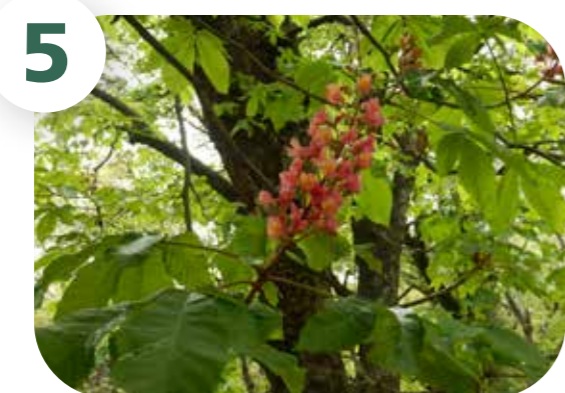
ベニバナトチノキ