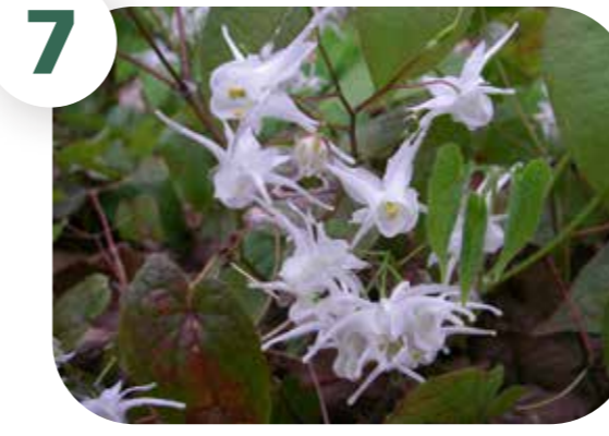
トキワイカリソウ