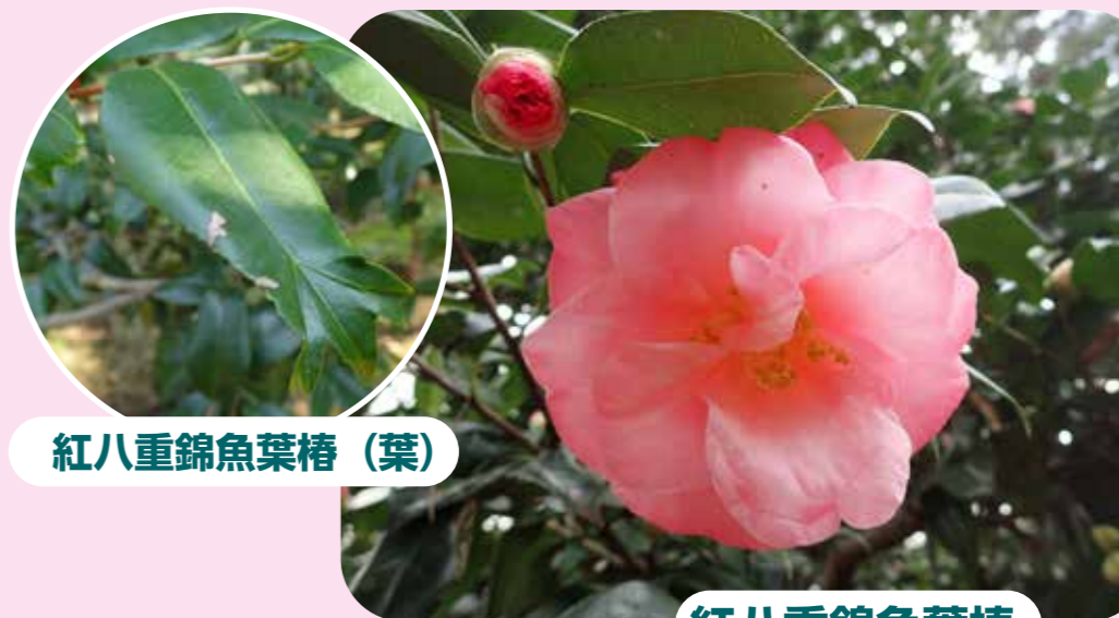
紅八重錦魚葉椿 (葉)