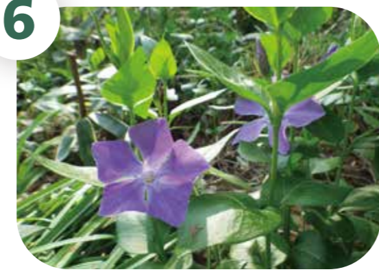
ツルニチニチソウ