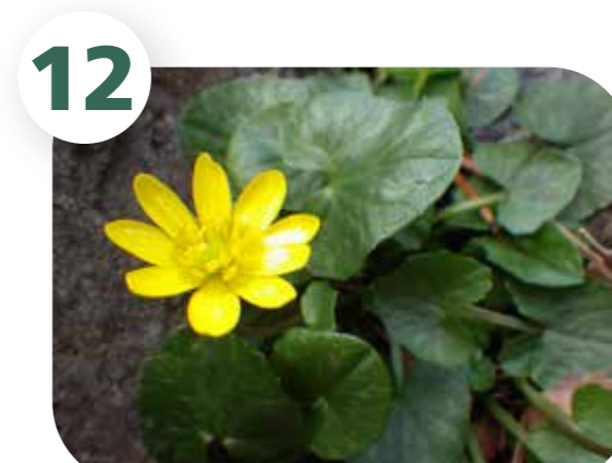
ヒメリユウキンカ