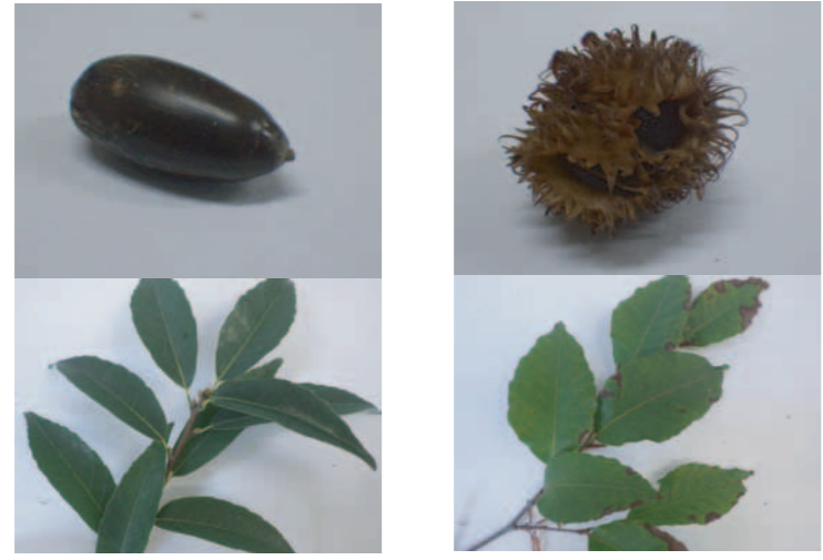
② シラカシ(1年型) ① ブナ(1年型)