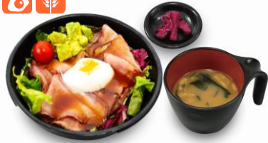
ローストビーフサラダ丼 (和山椒ソース)