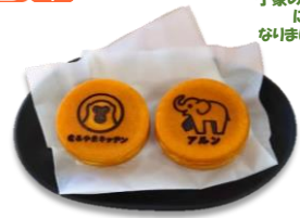
さるまん(つぶあん・カスタードの 大判焼き2個セット)