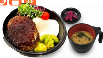
牛肉100%ハンバーグ丼 (たまねぎソース)