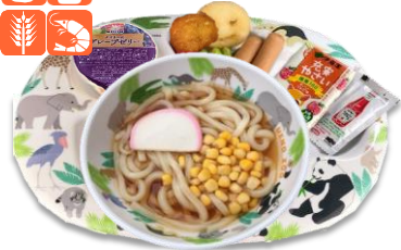
キッスうどんランチ