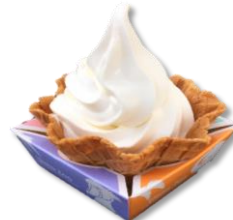
ソフトクリーム 北海道パニラ