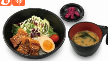
東京エックス角煮丼