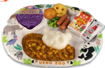
キッスカレーランチ