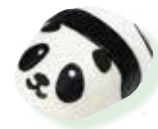
Panda-shaped steamed pork bun

There is one each in the East Garden and the West Garden (Outdoor Eating Space).