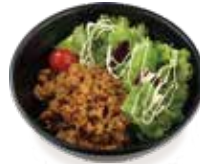
Ground soy-meat with rice bowl (East Garden)