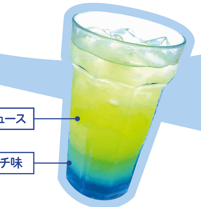
グレープフルーツジュース