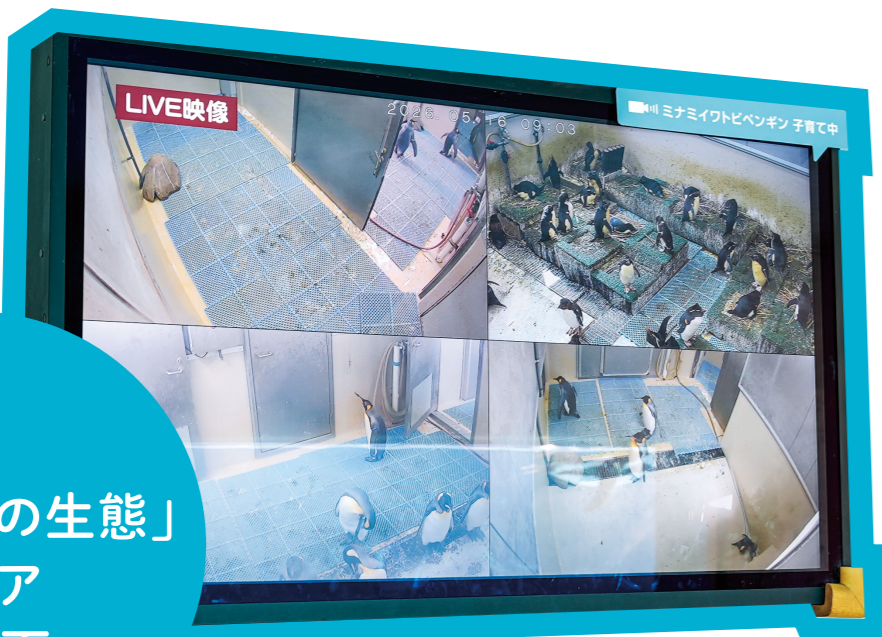
「ペンギンの生態」 エリア 階段下

涼しい環境に生息するペンギンは、夏はバックヤードの冷房室で過ごします。 冷房室の様子は「ペンギンの生態」エリアにあるモニターで LIVE 中継しています！