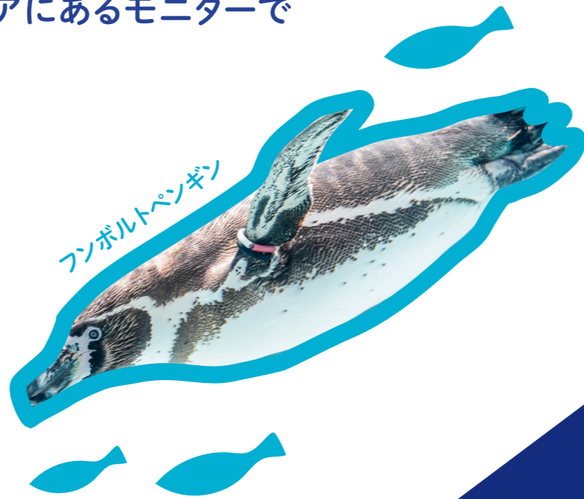
ファンボルトペンギン