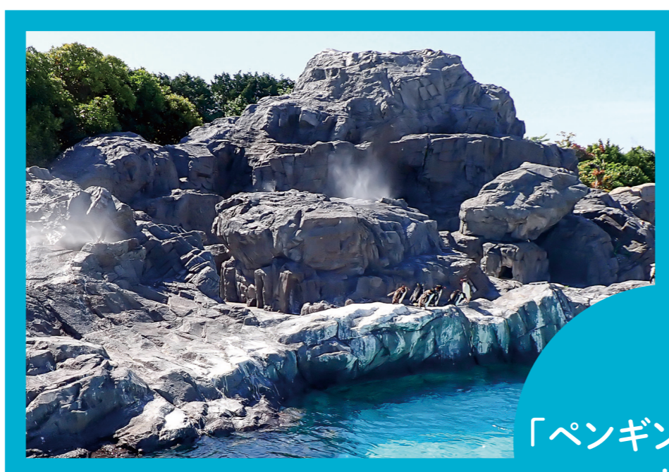
「ペンギンの生態」 エリア

外の展示場にいるペンギンは、 プールで泳いだり、スプリンクラーの 水を浴びたりして涼んでいます。