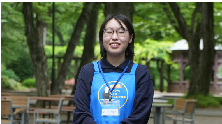
ボランティア（ドーセント・グループ）