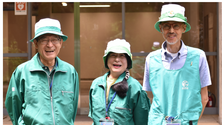
ボランティア（サービスガイド・グループ）