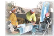
Service guide group