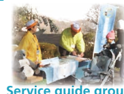
Service guide group