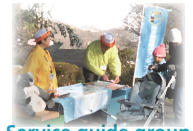
Service guide group