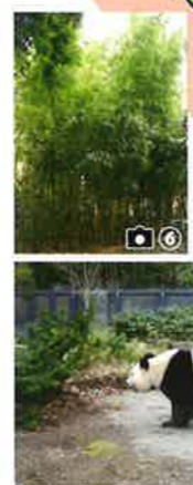
竹林 裏の竹林は、非常食!