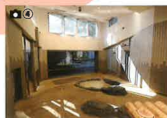
パンダの部屋 (室内) 木製のベッドやプール、床暖を完備。日光と取り入れる窓もあり、室内でも快適に過ごせる空間です。