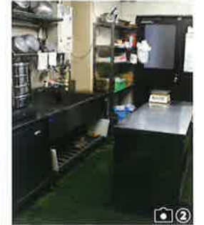
台所 飼育係はここでエサを用意します。パンダだんごもここで作っています。