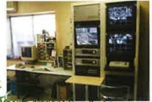
モニター室 (2階) 屋内・屋外全ての場所にカメラがあり、動物がどこにいても観察できるようになっています。