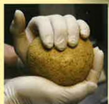
② 1個 400g のだんごを作る