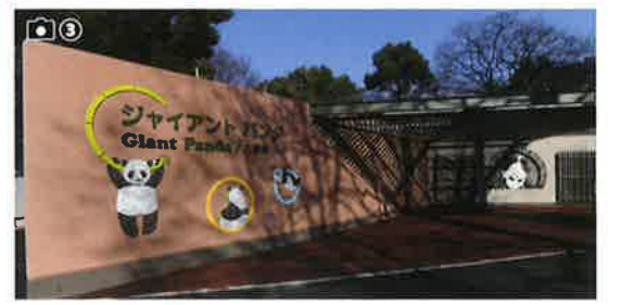
パンダ舎入口 かわいいタイルのパンダがお出迎え。パンダに関する情報パネルも充実しています。