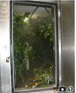
竹庫 1週間に2度運ばれてくる竹はここに保管します。5℃前後に保たれ、1日2回水が噴霧されます。