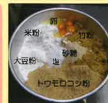
① 材料をまぜ、こねる