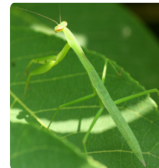
羽がない幼虫（6月撮影）。

春に生まれた幼虫は、同じく生まれたばかりの小さなバッタなどを食べて成長しています。背中に羽があれば成虫です。