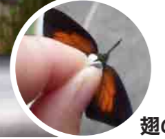
翅の内側の色は鮮やか。