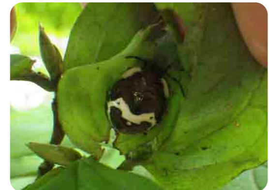
葉のすき間にかくれていたよ。

都会にくらす私たちの身近にも、実はいろいろな生き物がくらしています。何もいないように見えるのは、私たちがその存在に気づくことができないだけなのです。「いきもの広場」はそうした生き物たちとの出会いを楽しむ場です。