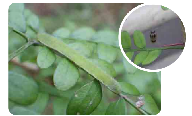
幼虫に寄生するハウネンタワラチビアメバチの蛹もみれるよ。