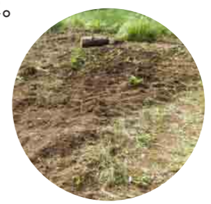
あとはいきものの力に任せてお休みです。