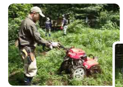
機械や人力で耕します。

7月22日に管理作業を行いました。原っぱの一部を耕し、お休みさせています。そうするとダンゴムシやミミズが土を柔らかくしてくれます。色んな植物が生えて、色んないきものが集まってくるようになりますよ。