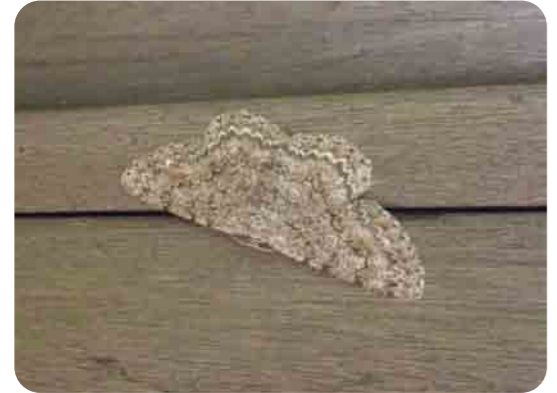
門の柱の色にまぎれています。