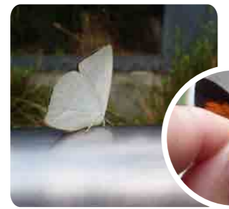
← ウラギンシジミ (ヤマネコ前)

「いきもの広場」ではありません。広場の外にだっていきものはいます。さがしてみよう。