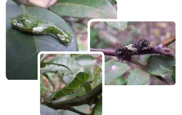
アゲハチョウのなかまの幼虫が2種類いるよ。大きさによって見た目も様々。