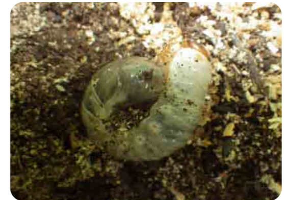
カブトムシの寝床を開放しています。土を掘って探してみよう。