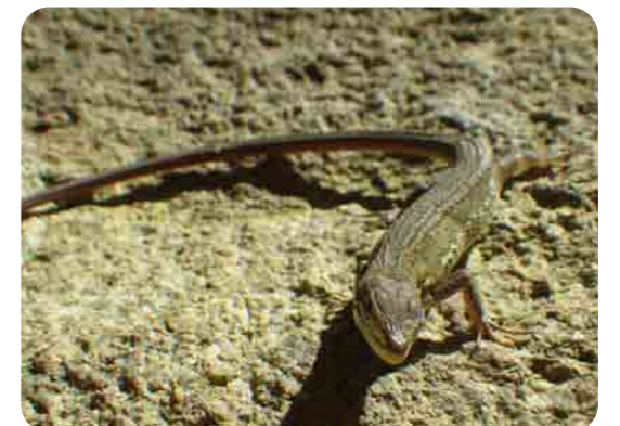
石の上でひなたぼっこをしているよ。