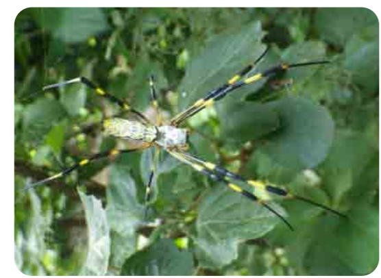
広場内のあちこちに大きな巣があるよ。引っかからないように気をつけよう。

都会にくらす私たちの身近にも、実はいろいろな生き物がくらしています。何もいないように見えるのは、私たちがその存在に気づくことができないだけなのです。「いきもの広場」はそうした生き物たちとの出会いを楽しむ場です。