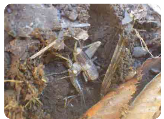
朽木の下で脱皮をしていました。