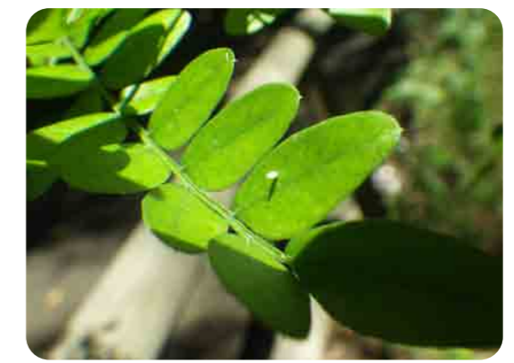
小さな卵が産み付けられていました。よく探してみよう。