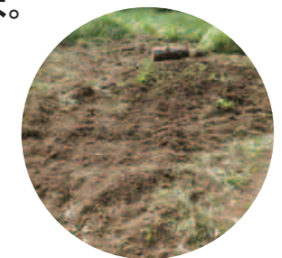
あとはいきものの力に任せてお休みです。