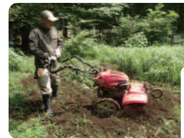
機械や人力で耕します。

7月22日に管理作業を行いました。原っぱの一部を耕し、お休みさせています。そうするとダンゴムシやミミズが土を柔らかくしてくれます。色んな植物が生えて、色んないきものが集まってくるようになりますよ。