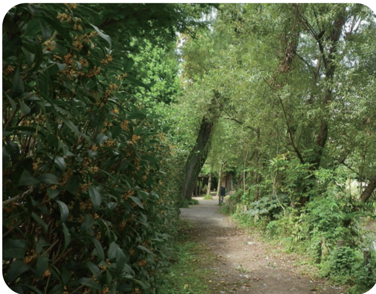
水生物園（分園）の水辺の小道に咲くキンモクセイ

葉の縁に切れ込みがあるかないかで見分けることができます。 ギンモクセイは細鋸歯が多いのが特徴です。