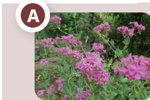
ムシトリナデシコ