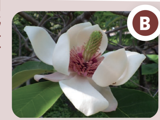
ウケザキオオヤマレンゲ