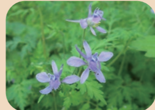
セリバヒエンソウ*