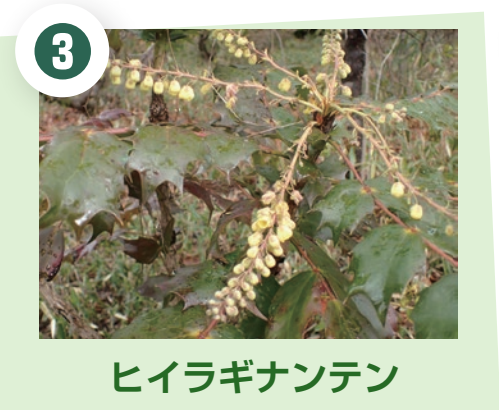
ヒイラギナンテン