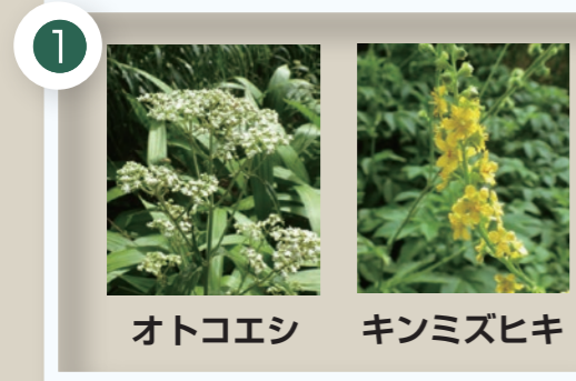
オトコエシ キンミズヒキ