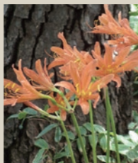
キツネノカミソリ