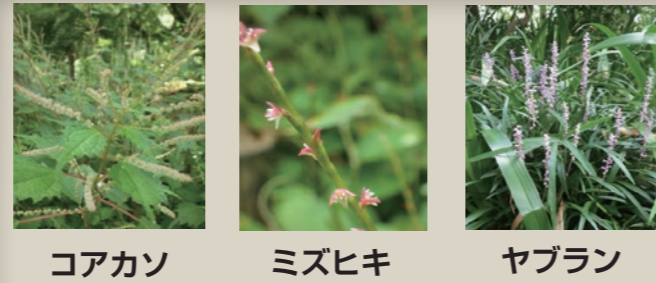
コアカソ ミズヒキ ヤブラン