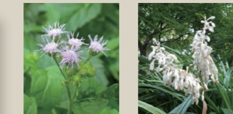
マルバフジバカマ ノシラン