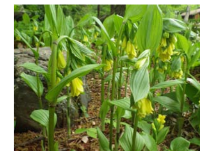
⑧ キバナホウチャクソウ