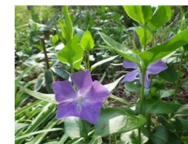
⑩ ツルニチニチソウ

若い葉が出てきた時、葉柄は立っ ているのに葉は、すぼめた傘のよ うな様子からこの名がつけました。