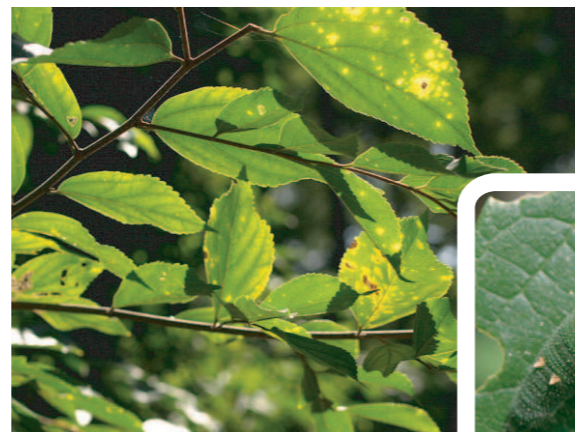
アカボシゴマダラ