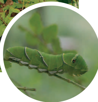
ナミアゲハの幼虫 ※成虫は⑤番